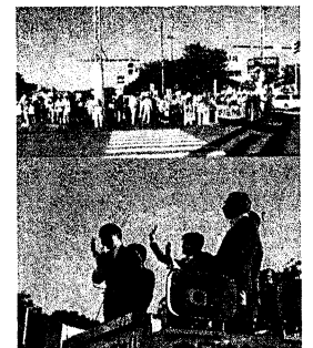
上越市の市民と野党の演説会